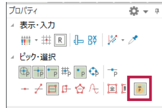
【パック指定】がオンのとき