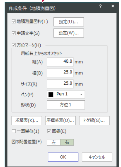
地積測量図の作成条件